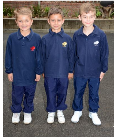
Langmou Evergymhemde mag slegs onder sweetpakbaadjie gedra word.